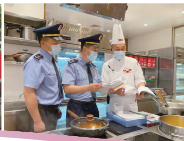
↑区市监局检查夏季饮食安全。

连日来，友谊街道西里社区组织开展“减轻灾害风险守护美好家园”防灾减灾主题宣传系列活动，向辖区居民发放宣传资料、在小区门口张贴宣传画报、组织生