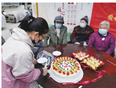
志愿者为老人们精心准备美味蛋糕。

愿服务活动暨法律知识科普宣传活动，邀请专业律师为居民解答法律问题，引导居民在工作和生活中要依法办事，以理性、合法的形式表达利益诉求，共同营造和谐文明的社区环境。