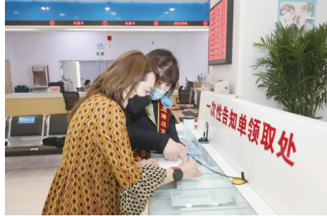
工作人员热情服务。

区行政审批局政务服务大厅设有咨询引导区、多媒体展示区、办事服务区、资料查阅区和等