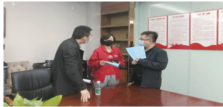
为企业提供一对一咨询，面对面服务。

创业实体，上门宣传解读享受政府补贴的技能培训、小额贷款贴息等政策。同时，专家现场对创业者提出的“如何提升员工的销售水平”“如何提升直播技能”“如何快速申请贴息贷款”等方面能享受的优惠政策进行了面对面、一对一的讲解答疑，让广大创业者充分了解了疫情以来各级人社