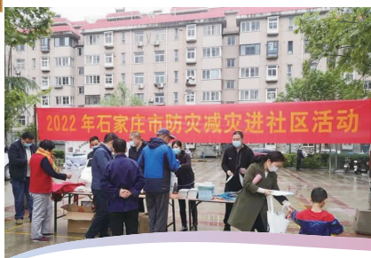
↑苑东街道裕新社区开展“5.12 防灾减灾知识”宣传活动。

连日来，我区以5月12日“防灾减灾日”为契机，开展多种形式宣传活动，普及生态环境灾害、地震灾害、火灾、洪涝灾害等各类灾害知识和防范应对基本技能。同时，各部门、各街道认真研判当前安全形势，根据辖区实际情况，多举措、全方面，扎实织牢安全生产防护网，打好“护平安”整体战。