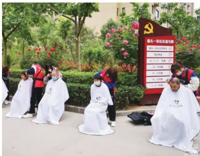
志愿者们细心地为居民们理发。

愿服务活动暨法律知识科普宣传活动，邀请专业律师为居民解答法律问题，引导居民在工作和生活中要依法办事，以理性、合法的形式表达利益诉求，共同营造和谐文明的社区环境。