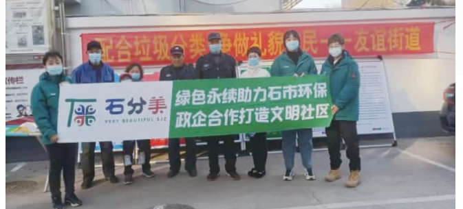
加强垃圾分类宣传。

为全面提高生活垃圾分类工作实效，推动辖区生活垃圾分类工作再上新台阶，5月6日-9日，区城管局根据街道实际情况，分别对各街道、社区负责同志开展垃圾分类工作培训，对我市《生活垃圾分类居民小区建设成效评分细则》进行详细讲解，逐项对分类成效、分类运输等方面工作进行安排部署。会后，各街道按照《石家庄市生活垃圾分类管理条例》加强执法检查，各社区继续强化居民小区生活垃圾分类工作宣传和落实，提高居民生活垃圾分类意识，完善垃圾分类设施，建立良好社区垃圾分类氛围。