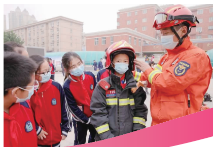
↑为同学们穿戴消防战斗服和头盔。

苑东街道裕新社区开展“5.12 防灾减灾知识”宣传活动，向居民普及推广针对暴雨洪涝、地震及家庭火灾的预防知识，并发放了宣传资料和防火用品，促使辖区居民提高抵御灾害意识，增强防灾减灾的责任感，提升基层应急能力，为人民群众规避风险、确保生命财产安全打下基础。3514社区组织工作人员在小区内开展燃气安全宣传，为辖区居民发放安全使用燃气防护手册，提醒居民注意燃气安全，从燃气安全常识、操作方法、漏气处理等方面为居民答疑解惑，有效提升了居民安全用气意识和应急防范意识，为避免燃气安全事故发生起到了积极作用。长兴街道张营社区一方面组织开展“社区防灾减灾及应急宣传教育”活动，向居民普及洪涝、台风、地震、火灾等各类灾害知识，提升广大