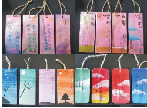
东马路小学举办第一届诗词大会“飞花令”。

四月春光盛,读书正当时。在第27个“世界读书日”来临之际,我区组织开展多种形式的主题活动,营造浓厚的读书氛围,弘扬全民阅读精神,鼓励居民多读书、读好书,点燃居民阅读热情,养成良好阅读习惯。