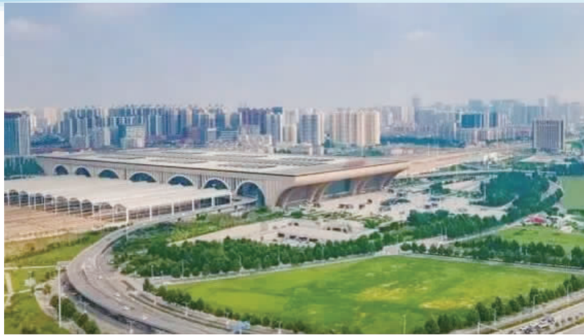
高铁片区中央绿色体育公园首开区域绿化基本完成。

叶女贞等树木或成排林立，或形成组团，错落有致、层次分明，生机盎然。而这里最引人注目的是网球场的建设，5座紧紧相邻、错落排列的网球场的围网已经安装完成，与周围的绿树交相辉映，给整个公园增添了朝气与活力。