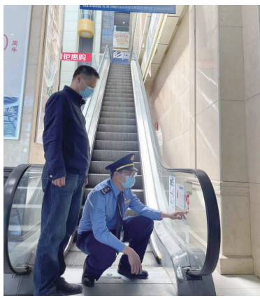
区市监局检查公共场所特种设备安全。

筑牢食品安全底线。结合节前市场消费特点,区市监局集中力量对辖区农贸市场、冷链食品经营户、大型商超、餐饮服务单位等开展食品安全监管。执法人员重点检查经营单位主体资格、食品进货台账、食品生产经营追溯管理系统“一品一码”录入和疫情防控措施落实情况,督促各经营单位要切实履行食品安全主体责任。严守特种设备安全。为保障“五一”期间辖区特种设备安全运行,区市监局对各大商超、酒店、游乐场等公共场所开展节前特种设备安全检查。执法人员重点查看了游乐设施及自动扶梯的运行情况、急停开关装置可