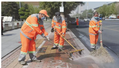
“人机结合”作业模式优势凸显。

区域管局组织开展沿街商户向收水井倾倒垃圾污水专项整治行动，督导商户落实“门前三包”责任，对沿街商户向收水井倾倒垃圾、污水的违法行为进行严厉打击，杜绝污水无序排放、垃圾乱扔乱倒现象。共摸排收水井12535座，并组织进行集中清理清洗，累计清掏、清洗220000余次，发放“餐厨垃圾收运明白纸”1400份，喷涂警示语、安装警示牌296块。