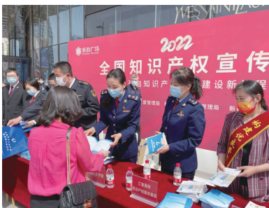
区市场监管局开展知识产权宣传。