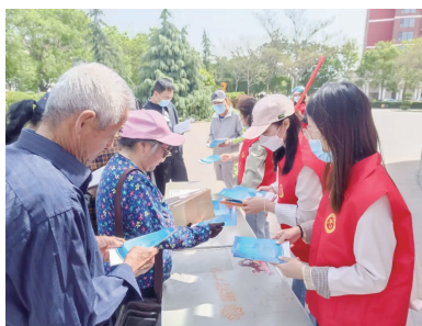
志愿者宣传知识产权知识。

1200余份。同时组织全区30多家企业代表开展“企业发展与知识产权战略”讲座,进一步提高企业知识产权意识,增强企业运用知识产权制度维护自身权益的能力,加快企业运用知识产权开拓市场步伐。开展知识产权暖企惠企“一对一”服务进企业,以“送政策、问需求、解难题”为切入点,多次深入石家庄西比克仪表有限公司、石家庄金鱼油漆厂等企业,详细了解企业近年经营状况和专利转化、专利导航、专利实施产业化工作开展情况,认真介绍有关专利方面的优惠政策,就专利布局、品牌建设、知识产权融资、专利保险、知识产权维权服务等问题进行精准指导,对企业诉求现场答疑解惑。截至目前,累计采集知识产权质押融资信息企业3家、申报河北省专利申请精准管理企业4家。通过助企帮扶进一步提高辖区知识产权创造、管理、运用、保护和服务水平,激发全社会创新活力。