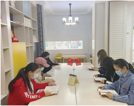
南长街道在八度书屋举办阅读活动。