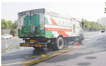
“人机结合”作业模式优势凸显。

在城市精细化管理巩固提升行动中，区域管局聚焦突出问题和薄弱环节，提高城市管理科学化、精细化、智能化水平，营造优良的城市环境。