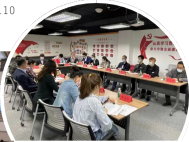
召开红色联盟党建联席会。

非公企业和社会组织出资人(负责人)的一封信》,向各个企业准确传达上级政策;设计印发中山街道华润万象城党群服务中心宣传册、“楼小二”服务项目宣传册,让企业更直观地了解楼宇党建内容;利用写字楼宣传屏循环播放楼宇党建内容,营造良好的红色氛围;在党建联盟微信群中发布每次活动的方案,诚邀企业党员职工参加,实现了楼宇企业党员职工从被动接受到主动参与的转变。