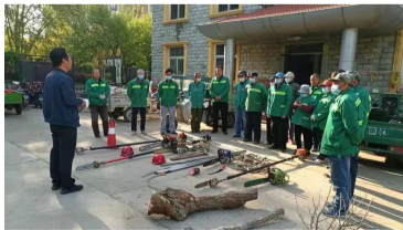
绿管队开展防汛抗旱演练。

现场,设置警示标志、快速安全处置倒伏树木以及高空作业车规范使用各环节进行了模拟。通过演练,进一步增强了园林绿化防汛应急抢险队伍的综合素养,总结经验、查找不足,不断完善应急预案,切实提高灾情险情的处置能力,为安全度汛提供有力保障。