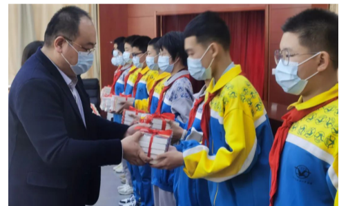
企业向学校捐赠图书。

近日，团区委在石家庄市第四十一中学北校开展“书送希望，向光而行”微心愿圆梦活动。