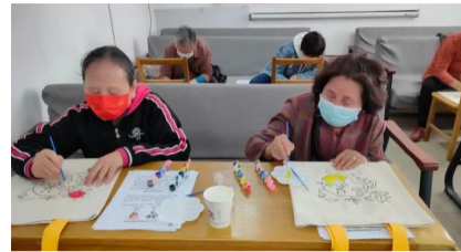
居民亲手绘制帆布袋。

维明街道泰华街社区开展“创意帆布袋 环保新时尚”主题活动,组织居民亲手绘制帆布袋,聊聊环保新话题,减少塑料袋使用,培养社区居民绿色环保的可持续生活理念,为生态文明建设贡献力量。