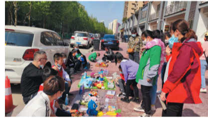
跳蚤小市场儿童义卖活动。