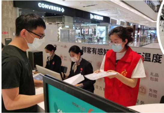
“楼小二”提供人才绿卡房租补贴红色代办服务。

为了打消企业顾虑,建立相互信任,街道开展了反复“扫楼”和深入宣传,掌握了企业底数和需求。第一次,通过微信小程序发放线上问卷,了解了