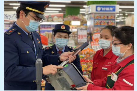
工作人员检查计量器具。

近日,区市监局开展民生计量器具专项检查,进一步规范市场计量秩序,保障消费者合法权益。