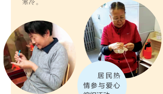
居民热情参与爱心编织活动。

据悉,此次活动作品将支援新疆巴州少数民族儿童和河南灾区儿童,让他们的冬天不再寒冷。