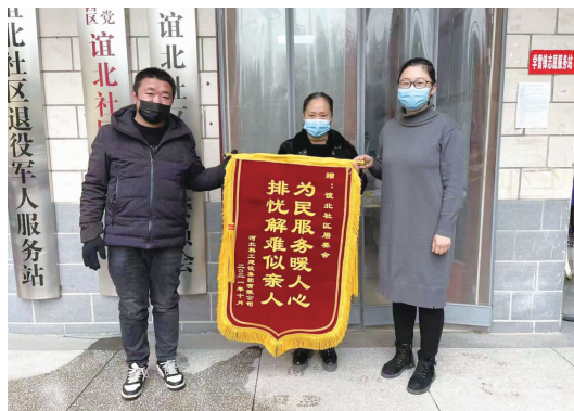
居民代表送锦旗表感谢

谊北社区一直将居民冷暖问题放在心上。每年都要因为供暖问题和供热公司提前沟通协商。为了彻底解决居民供暖问题，提高居民生活质量，谊北社区以担当，践行执政为民理念，与区供热办一起，一次次与居民沟通征求意见，最终决定实行住户暖气串改并。11月1日，国防建宿舍暖气串改并正式启用，目前，小区供暖正常。居民们纷纷点赞，都说现在的谊北社区更加温暖了。