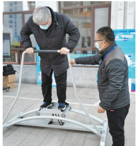
居民体验冰雪运动

为营造期盼冬奥、喜迎盛事的浓厚氛围，因地制宜地推广群众冰雪运动，12月2日，振头街道欧景园社区举办了一场“迷你冬奥会”进社区活动。