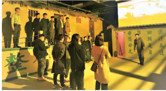
在沉浸式剧场形式开展红色教育。