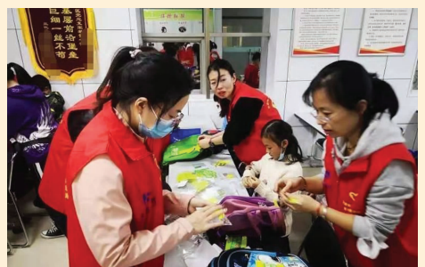
志愿者在孩子们书包上贴反光条和夜光条。

反光条、夜光条和挂坠可以贴在孩子们的衣服上和书包上,在黑暗或者光线不足的地方,如后方来车车灯照在上面,其反射的光线能对后方来车起到及时有效的提示作用,从而提高孩子们的道路安全性。