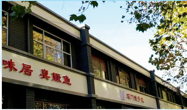
灰白为主的建筑外立面，突出街道“民国风”的景观特色。

街道干净整洁，装潢清新统一，设施简洁便利……近日，石家庄桥西区时光街面目一新，重装亮相。