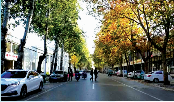
改造后的时光街宽敞明亮。