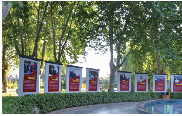
劳动公园劳模文化长廊。

桥西区劳动公园的设计建造，是我区提升城市品位，加快建设现代化、国际化美丽省会城市的重要举措，在全区进一步营造了劳动光荣的社会风尚和精益求精的敬业风气，团结动员广大职工群众在奋斗新征程上进行伟大的劳动创造，以不懈奋斗书写新时代华章。