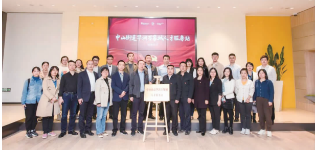
建立华润万象城人才服务站。

华润万象城是世界500强企业华润集团旗下开发的高品质购物中心,涵盖零售、餐饮、精品超市、主题街区、影院、家庭服务、儿童娱乐、个人护理、书店等多种业态。中山街道华润万象城党群服务中心位于华润大厦B座B3层西南角,地处省会核心区域,交通便利、人流顺畅。