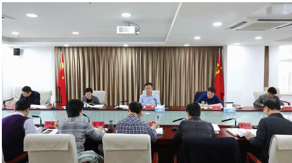
区委书记孙鹏云主持召开区委理论学习中心组学习会。

孙鹏云指出,要坚持依法治区,切实提升治理现代化能力和水平。习近平总书记的署名文章,站位高远,系统论述了坚持依法治国的重要性、必要性和关键作用,为我们做好法治工作提