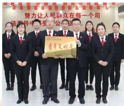
区法院执行事务中心干警获评“石家庄市青年文明号”。

2020年以来,执行事务中心共受理执行案件8797件,送达法律文书1.3万余份,网络查控冻结存款4.9亿余元,维护了当事人合法权益,提升了群众的司法获得感和满意度。