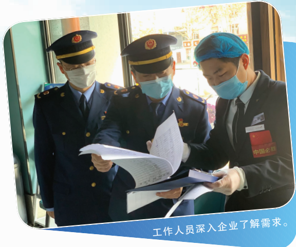
工作人员深入企业了解需求。

为助力中小企业复工复产,区市监局创新服务举措,忧企业之忧,急企业之急,组织业务科室、基层市场监管所深入