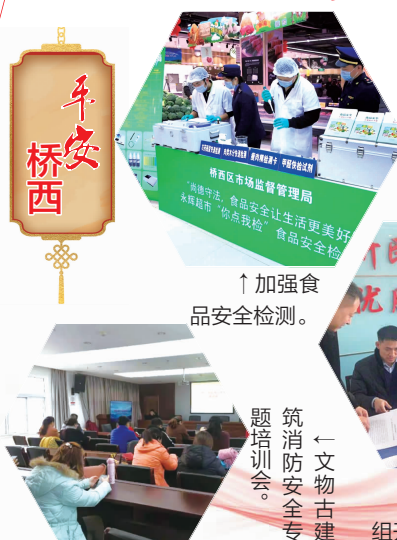
↑加强食品安全检测。

区文体旅局开展“桥西区文物古建筑消防安全专题培训会”,针对文物古建筑消防安全管理中存在的问题,结合近年来全国文物博物馆单位火灾事故案例,详细讲解火灾的危害以及具备扑救初期火灾能力的重要性,并提醒工作人员务必增强防火意识,切实做好火灾预防工作。