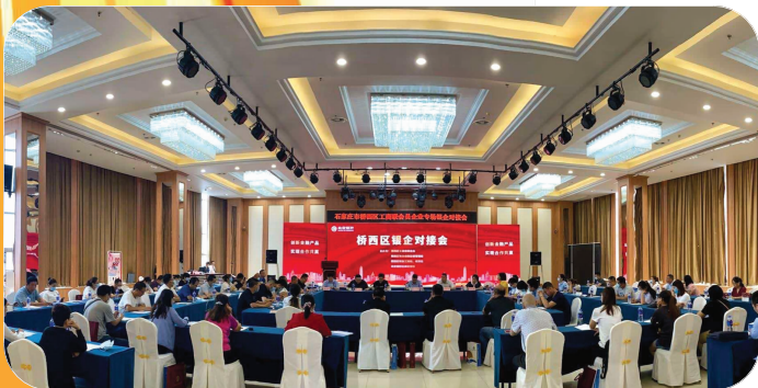
联合金融企业召开工商联合会、政协委员企业银企专场对接会。

对历史最好的致敬 是书写更辉煌的历史,对未来最好的憧憬是开创更美好的未来。“十三五”圆满收官,桥西区经济高质量发展取得了优异成绩;展望“十四五”,在新的历史起点上,桥西区将开启新的壮丽航程,奋力书写现代幸福美丽桥西的发展新篇章。