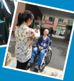
▲手机上为老人办理健康认证。