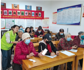
南长街道电业局南院社区开展智能手机小课堂活动。