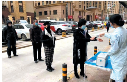
煤市路社区疫情防控现场演练。

通过系列防疫演练,提升了各单位疫情防控应急处置能力,检验了社区人员的协作配合能力,规范了社区防疫应急处置流程,为营造安全社区打下了扎实的基础。