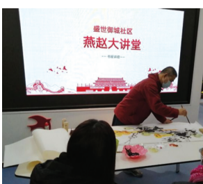
振头街道盛世御城社区举办中国书画普及讲座。

南长街道电业局南院社区开展“加科技,近距离”主题智能手机小课堂活动,满足社区居民特别是老人学习使用智能手机的需求,让老年人体会到科技带来的生活便利。