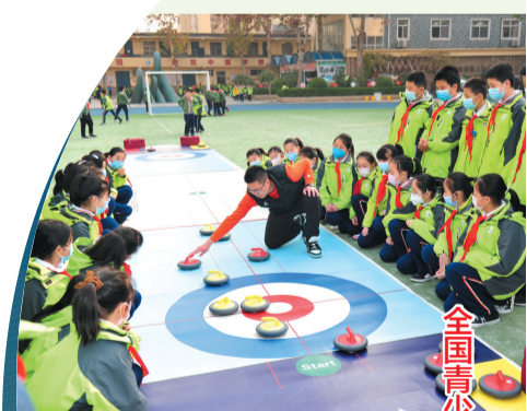
全国青少年校园冰雪体育传统特色学校称号 东风西路小学喜获