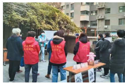
休门街道演练活动。