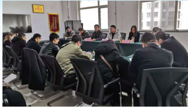
孵化载体运营辅导座谈会。

存在的问题并进行了针对性指导,及时解开各孵化载体在绩效考核、认定评级方面的困惑,明确了发展方向,促进了我区众创空间、孵化器的良性发展。此次座谈会提升了我区孵化载体市场化、专业化服务水平,帮助孵化载体解决发展过程中存在的问题,促进了我区孵化载体提质升级。