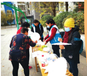
西里街道安惠社区开展“小伞上的艺术”绘画活动。