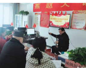
新石街道祥云国际社区开展戏曲进社区活动。