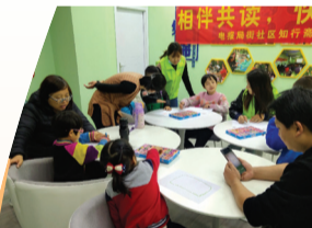
东华街道电报局街社区举行“相伴共读,快乐成长”亲子小组活动。

汇通街道汇祥社区开展垃圾分类主题活动,引导居民们将带有垃圾图案的卡片投放到正确的垃圾箱内,通过一起完成互动游戏来加深居民对垃圾分类的认识,提高垃圾分类的意识,增强节能减排的科学观念。