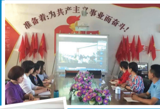
►中华南大街小学学区三校和天津手拉手学校开展网络连片教研活动。

随着互联网信息技术越来越深刻地影响着社会生产和居民生活,桥西区借互联网深度应用之势,将“互联网+社会服务”作为不断拓展消费惠民新增长点,深入推进供给侧结构性改革的重要手段,助力“互联网+社会服务”驶入发展快车道,不断优化社会服务的方式和途径,实现优质社会服务资源下沉、扩大辐射覆盖范围,惠及辖区居民,提升民生福祉。