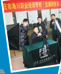
◀学员们正在直播销售员课程。