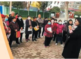
汇通街道汇祥社区开展垃圾分类主题活动。