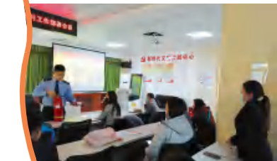
苑东街道举办第四季度消防安全培训会。