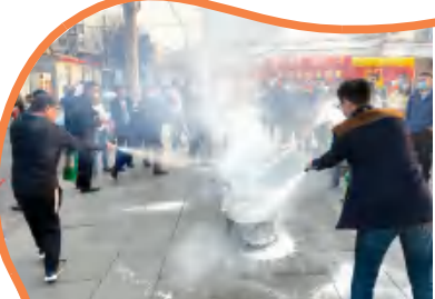
休门街道开展冬季消防演练。

操作相结合的方式进行了灭火器使用演练,现场人员认真学习聆听,并在指导下严格按照操作规程,有序进行操作演练。通过系列活动,提高了辖区居民安全防范意识,增强了火灾逃生自救和应急处置能力,营造了消防宣传教育浓厚氛围,为筑牢辖区消防安全稳定夯实了基础。