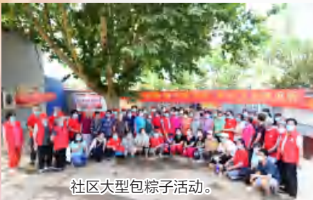
社区大型包饺子活动。

社区着力构建“五型社区”党建工作做法，坚持社区党组织的核心统领，充分发挥老党员志愿服务引领社区建设作用。通过一个标准——社区一切工作以居民“满意”为标准；一个抓手——以党建网格化管理为抓手；一个载体——以各类志愿服务为载体；一个依托——以与辖区单位共建共建为依托；一个目标——以“建设服务型社区党组织”和“建设文明和谐美丽社区”为目标五项具体措施，构建文明社区、和谐社区、文化社区、健康社区、美丽社区“五型社区”。