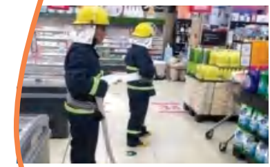
友谊街道西里社区积极组织职工消防演练。