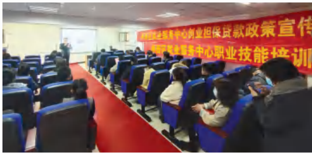
“进基地、送政策、促就业”活动现场。

责人表示，组织开展以送政策进社区、进企业、进高校宣讲活动，就为了加大就业创业政策落实力度，推动和强化我区就业创业工作，全面提高政策的知晓率和扶持精准度，确保就业创业惠民政策全部落地。接下来，中心将继续到高校、戒毒所等地开展这样的活动，政策宣讲活动将一直持续到12月底。