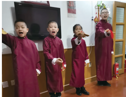
传统文化传承社在老年公寓演出《报母恩》。