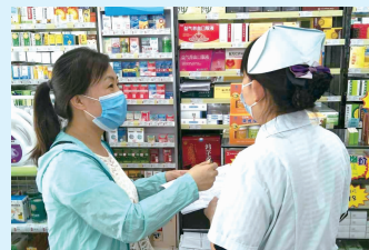
彭后街道检查计生设备。