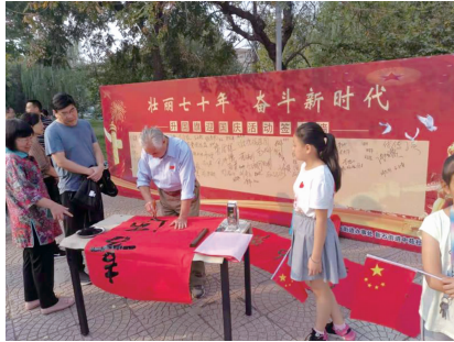
中苑书画社长现场写作。